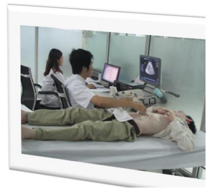
Hình ảnh siêu âm thai